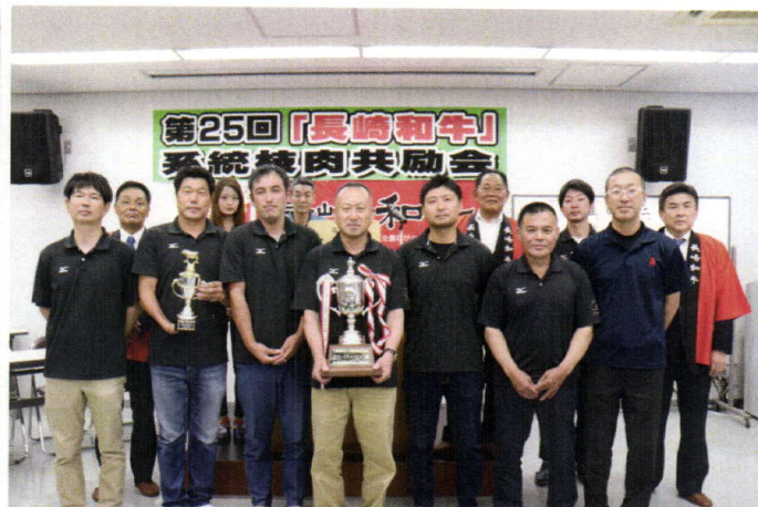
受賞された生産者のみなさん