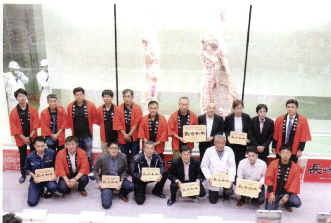
セリ終了後、購買者のみなさんと写真撮影